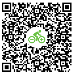
SmartphoneGrip avec kit d'installation